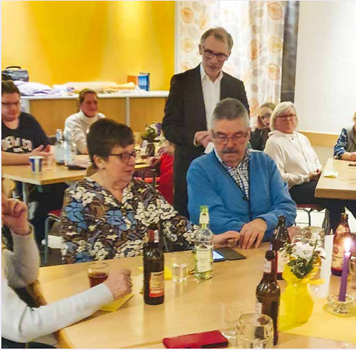
Ein Quiz über unsere Gemeinde war ein unterhaltsamer Programmpunkt. Die Antworten erfolgten über das Smartphone.