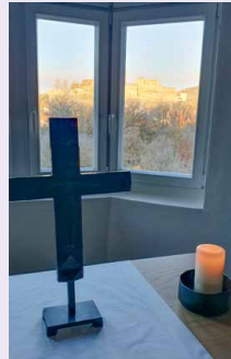
Morgenandacht mit Burgblick