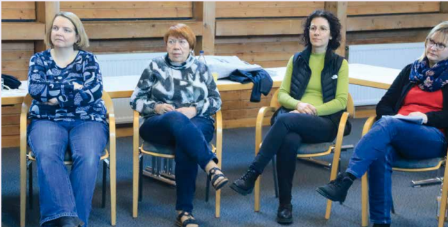
Gemeinsamer Austausch im Pleinfelder KV

Am Ende der Tagung blickten alle geschafft, aber zufrieden auf die sehr gute und konstruktive Arbeit zurück. Sowohl innerhalb unseres KV, als auch hinsichtlich der Arbeit mit dem Ellinger KV freuen wir uns auf die weitere Zusammenarbeit.